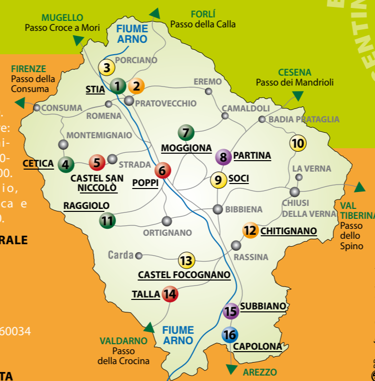
DB grafica - Piatreschio (Merz)

14 CASA NATALE di GUIDO MONACO e CENTRO di DOCUMENTAZIONE sulla MUSICA MEDIEVALE Loc. La castellaccia, Talla. Informazioni e aperture su richiesta: Comune di Talla, 0575/597512 - Pro Loco "Guido Monaco" 338/3573501. Orari di Apertura: Sabato e Domenica 16:00 - 18:00.