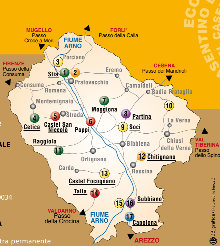
DB grafica e Pratovecchio (Merz)

14 CASA NATALE di GUIDO MONACO e CENTRO di DOC. SULLA MUSICA MEDIEVALE Loc. La castellaccia, Talla. Informazioni e aperture su richiesta: Comune di Talla, 0575/597512 - Pro Loco "Guido Monaco" 338/3573501. Orari di Apertura: Sabato e Domenica 16:00 - 18:00.